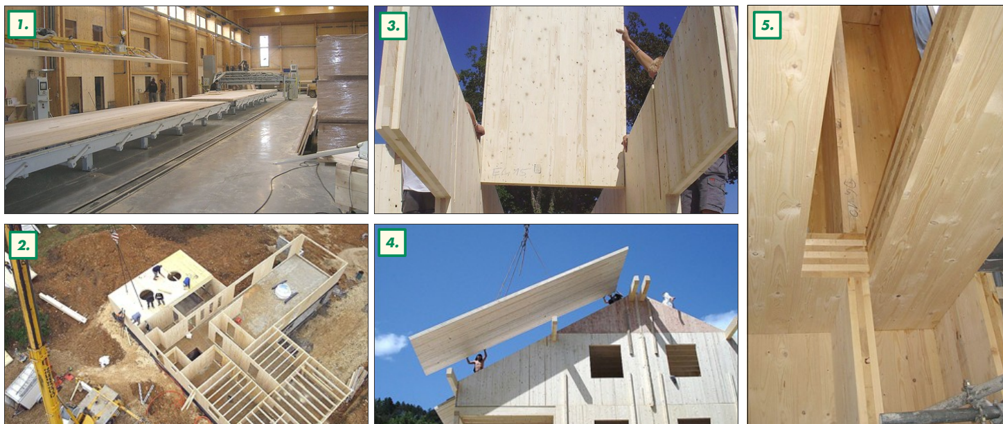
1. Les panneaux étant usinés pli par pli, les réservations techniques peuvent se faire dans n'importe quel pli; 2. Le plus gros du travail est réalisé en conception et en préfabrication; 3. Une préconstruction extrêmement minutieuse permet un montage rapide et aisé; 4. Quelques jours suffisent à une équipe réduite pour réaliser le montage; 5. On aperçoit bien les plis croisés des panneaux: 7 plis pour le plancher et 3 plis pour les murs intérieurs

tion et de la pose ni dans le temps. Le CSTC (Centre Scientifique et Technique de la Construction) et l'Université de Liège vont procéder à une série de tests au niveau de la résistance thermique, acoustique, au feu, statique et parasismique.